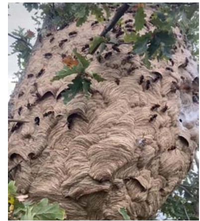
Un nid de frelons asiatiques détruit à Montastruc. Il mesurait 1m10 de haut par 0,95m de large, A local hornets nest over 1 metre high

Cela fait plusieurs années qu'on parle de l'invasion du frelon asiatique. C'est une catastrophe car ils font beaucoup de dégâts, et surtout détruisent les ruches. Un apiculteur local a déjà perdu 25 ruches, si cela continue il n'y aura plus d'abeilles sauvages d'ici 4 ans... Les abeilles pollinisent les plantes et les arbres et nous fournissent du miel. Dans la région, seuls 5% des nids sont détruits, or, chaque nid primaire contient 2500 frelons dont 500 reines et quand elles partent elles fabriquent 500 nids ailleurs dans un rayon de 3 kms. Les frelons asiatiques sont plus petits que les frelons européens, noirs avec des pattes oranges. Il faut absolument faire des pièges sélectifs (pour ne pas piéger les abeilles) et les accrocher dans les arbres. Page 3, on vous explique comment fabriquer un piège. Si vous voyez des frelons, il faut trouver le nid et appeler un professionnel pour le détruire en sachant que très souvent plusieurs nids se trouvent à proximité. Par contre il ne faut pas essayer de détruire les nids soi-même, ils peuvent contenir 7000 frelons qui attaquent à la moindre vibration ou menace.